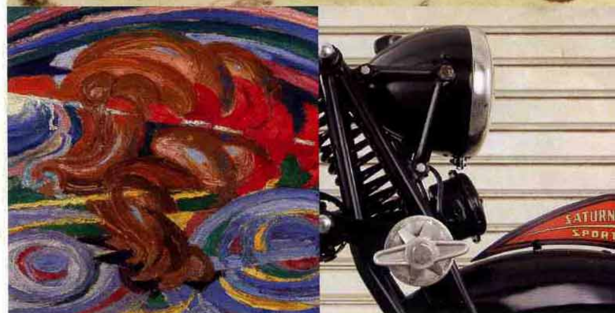
grafica Guido Mapelli